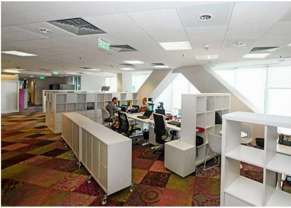
În open space mobilierul este IKEA, Estel.com, iar paravanele separatoare din fetru vin de la Buzzy Space.