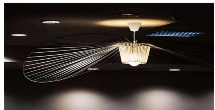
Corpul de iluminat solar a fost găsit la Vertigo.

Am propus un mix and match între piese de birouri mai populare și obiecte de design celebre, care schimbă mult echilibrul vizual în favoarea unei atmosfere estetice. Am utilizat piese de mobilier și obiecte auxiliare ale designerilor italieni, danezi și suedezi.