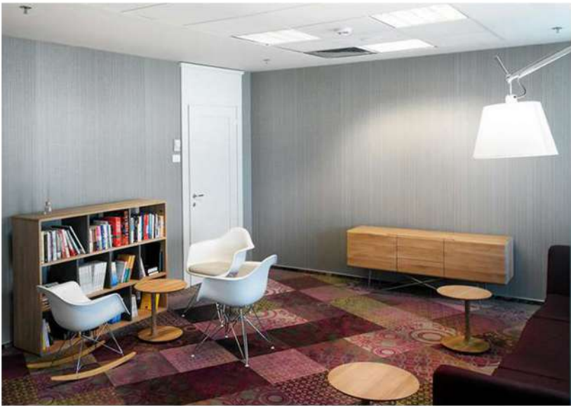
Scaunul-balansoar este și el tot marca Eames, în timp ce canapeaua de la super brandul B&T, din Turcia, cu husă textilă customizată, a fost aliniată la paleta cromatică a biroului.

Alburile sunt dominante inducând luminozitate și o atmosferă eterică, inspirând relaxare și o stare de bine. Accentele sunt din gama de rozuri fucsia, violeturi, purpuriuri, iar ca un contrapunct apar nuanțele de verde complementar. Aceste culori vibrante inspiră dinamism și energie.