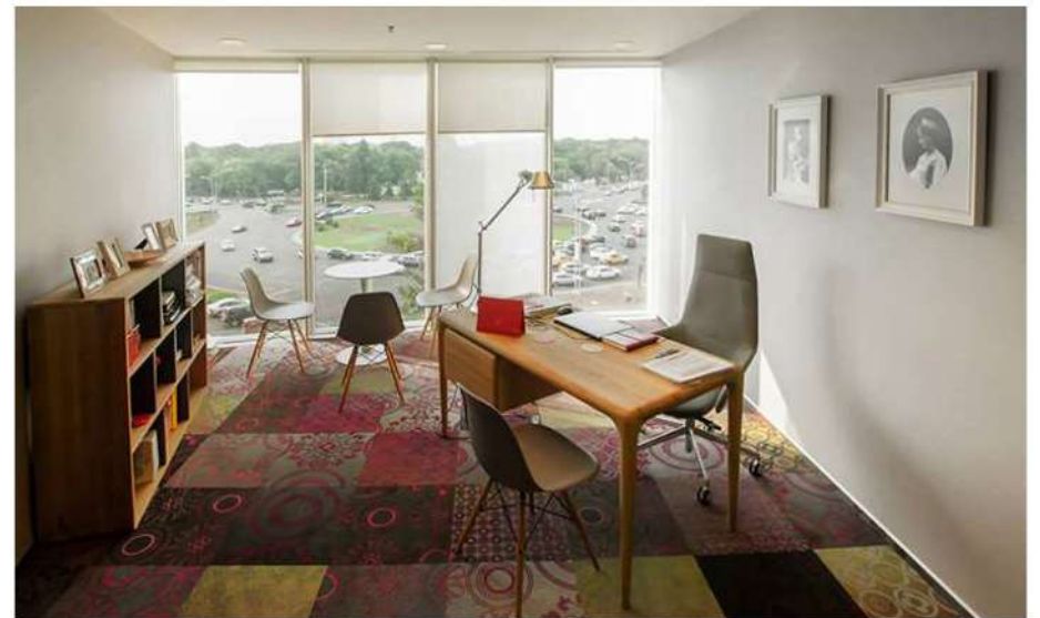
Mobilierul din lemn cald, cu forme organice, vine de la Artisan, iar scaunele Eames au fost achiziționate de pe Vitra.com.